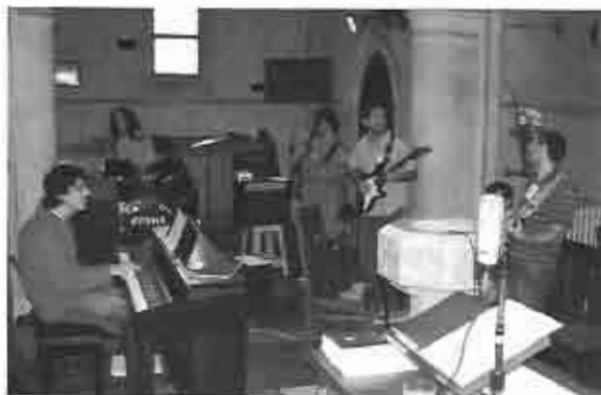
Grupo musical de adoración