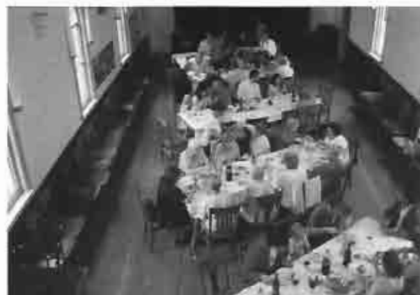
El salón de actos durante el almuerzo