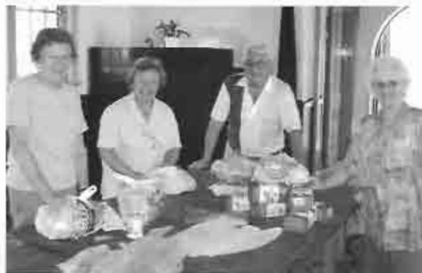
Marjorie, Beti, Quito y Coca embolsando alimentos para acción social