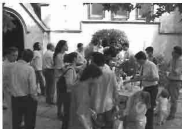
Intermedio para disfrutar de una merienda