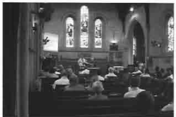
Durante las deliberaciones