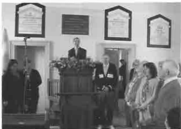
Presentación de la comisión organizadora de los festejos del sesquicentenario