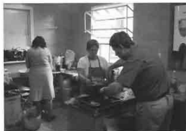
Los cocineros en plena tarea